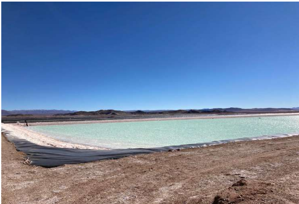
Figura 1: Pileta de evaporación en SHM, Antofagasta de la Sierra, Catamarca.

Este trabajo aborda un conflicto actual, en la Puna del noroeste argentino, inmerso en un contexto global donde el aumento del valor del litio en el mercado mundial lleva a las empresas internacionales a poner su interés en las regiones que poseen este recurso en abundancia. Argentina, Chile y Bolivia pasaron a formar el “triángulo del litio” (Aguilar y Zeller, 2012), porque en sus salares se encuentran las mayores reservas de litio del mundo. Este metal es codiciado por ser necesario para fabricar baterías de artefactos que se han vuelto masivos en los últimos años, como celulares y computadoras portátiles. Pero será usado en cantidades mucho mayores para fabricar las baterías de los autos eléctricos. Por otra parte, el litio es promocionado como una energía renovable, sustentable (cuando sólo es acumulador de energía), una nueva propuesta energética para la sociedad de consumo, mucho más limpia que el ya escaso petróleo (Puente y Argento, 2015).