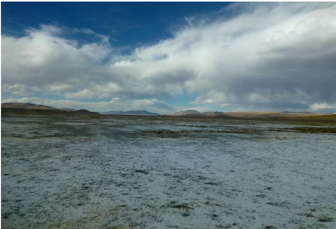
Figura 2: Salar del Hombre Muerto.

Podemos pensar a la minería de litio como parte de la reconfiguración de las políticas y los discursos extractivistas. Resta analizar los múltiples sentidos que este cambio conlleva.