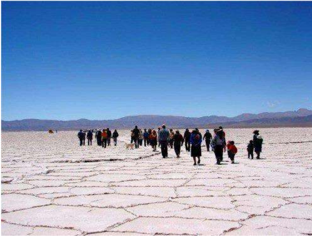
Figura 5: Marcha de la Sal. Salinas Grandes, Jujuy, 2019.

Por último, la situación resulta alarmante en Olaroz (Susques, prov. de Jujuy), ya que la afectación de los ecosistemas y de las economías locales a causa de la minería de litio es significativa, y la disminución de los acuíferos debido a la succión de aguas fósiles está provocando daños irreversibles. Aparece como un denominador común la falta de consulta a los pobladores y comunidades indígenas, y la puesta en marcha de procesos fraudulentos, a puertas cerradas, con presencia únicamente de trabajadores de las mineras (Jerez, 2018).