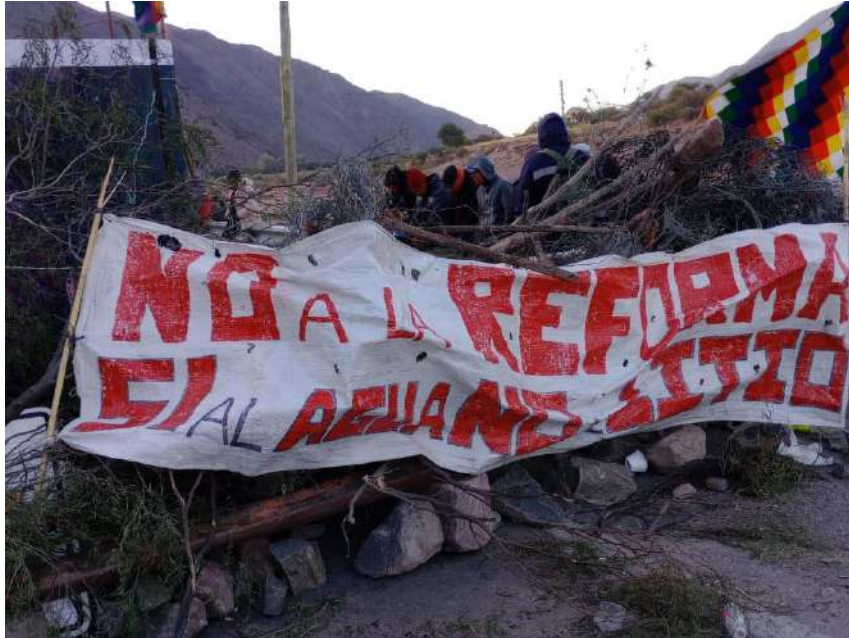
Figura 6: Corte en Purmamarca, Jujuy. Junio 2023.

hegemónicos, modifica el status de los pueblos indígenas y sobre todo acapara para el estado la determinación sobre tierras fiscales y el uso del agua, que serán destinados a su arbitrio, dándole prioridad a la producción minera.