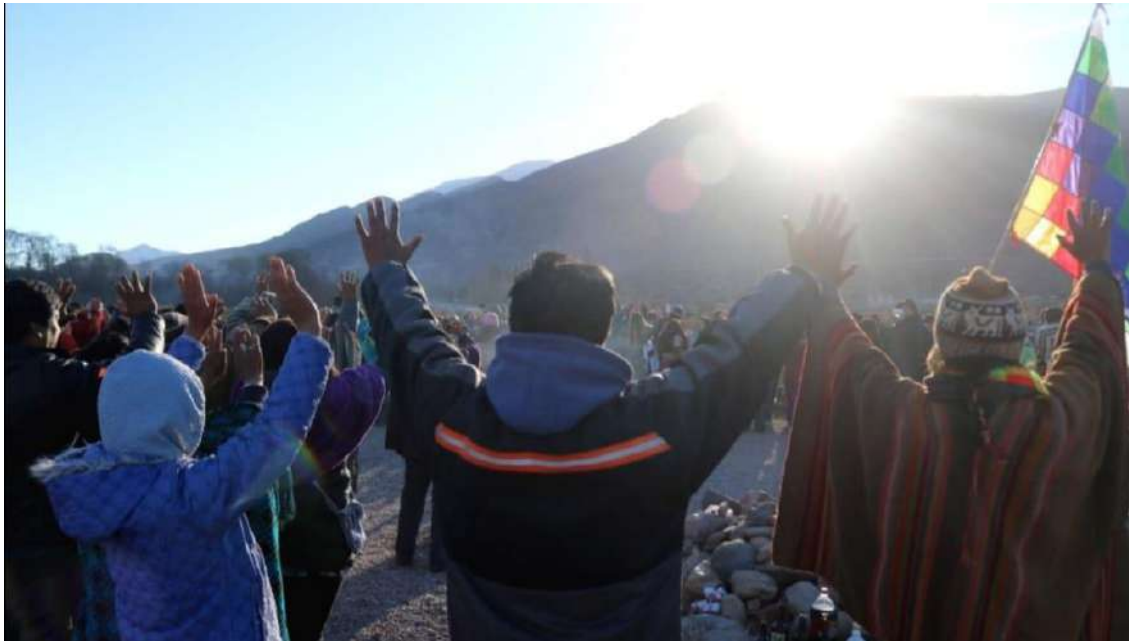
Figura 8: Celebración del solsticio de invierno, Purmamarca. Junio 2023.

El agua es para sustentar la vida y no para las mineras. El agua vale más que el litio.