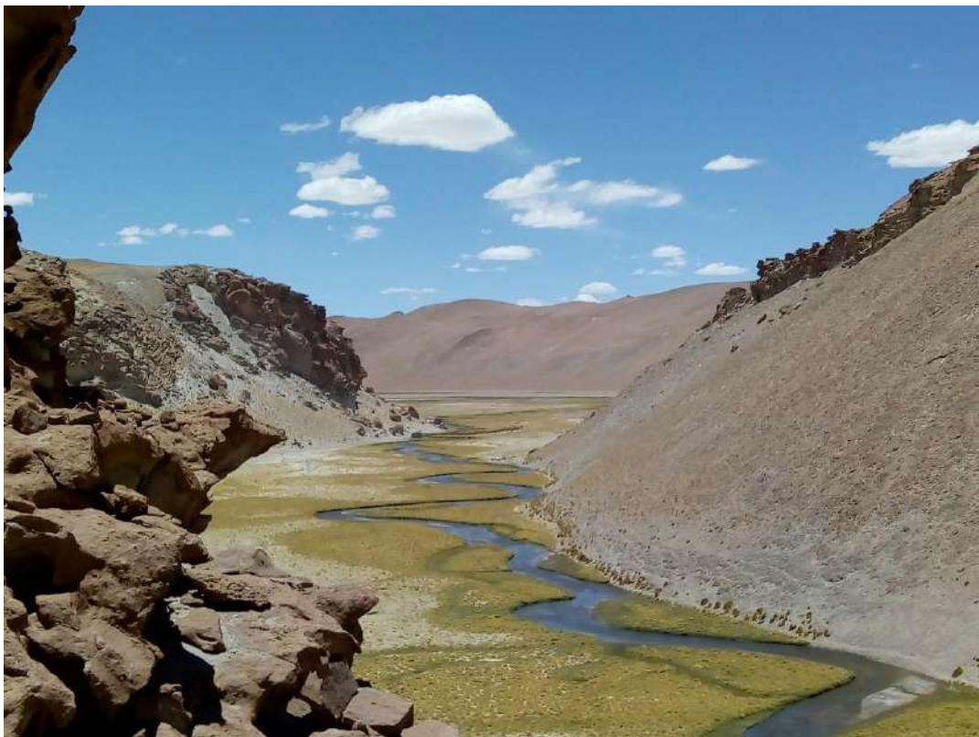
Figura 3: Río Los Patos, SHM.

Muerto ocupa una superficie aproximada de 588 km 2 y se encuentra a unos 4000 m sobre el nivel del mar, abarcando parte de las superficies de Catamarca y Salta. Las reservas del salar se estiman entre 360.000 y 400.000 toneladas métricas (tnm) de litio, comprendidas en una profundidad entre los 0 a 30 metros, que si se extienden hasta los 70 metros totalizan 850.000 tnm. De esta manera, se estipula que el Proyecto Fénix podría tener a los actuales ritmos de extracción unos 40 años de vida” (Slipak, 2015: 94)