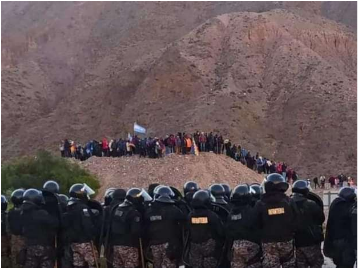
Figura 7: Corte en Purmamarca, Jujuy. Junio 2023.